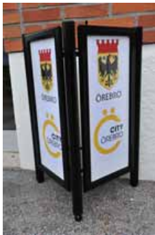
Bild på tillåten reklamskylt

Reklamskylten ("överdagenskylt", se bild) ska stå i direkt anslutning till entrén i butiken och ska tas in när verksamheten är stängd. Tillstånd måste sökas hos polisen för att ha en reklamskylt. Endast angivna typer av reklamskylt är tillåtna.