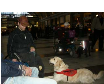
Matte och Frasse

De tre ekipagen hade inte träffats förut så det var dels en träning för hundarna att inte bry sig om de andra hundarna, dels miljöträning och dels momentträning.