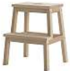
Pall Bekväm 99 kronor

Efter det for jag iväg på IKEA och köpte mig den lilla pallen som skulle vara bra att ha till både lysknappar och Kleenex-lådor. Tyvärr visade det sig att pengarna var slut på kontot så trots att jag gick i sisådär 20 affärer så bidde det bara den pallen för 99 kronor inhandlat.